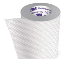
3M™ Multipore™ Dry

Weitere 3M Rollenpflaster mit hoher Klebkraft: