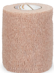
3M™ Coban™ selbsthaftende Binde