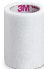
3M™ Medipore™ Vliespflaster