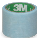
3M™ Micropore™ S Silikonrollenpflaster

Weitere multifunktionale 3M Rollenpflaster: